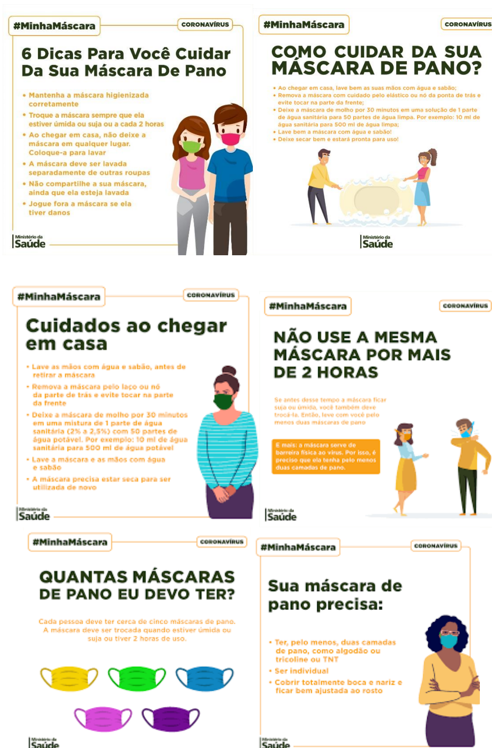
FIGURAS 3 a 6 - Materiais sobre o uso de máscaras caseiras do Ministério da Saúde