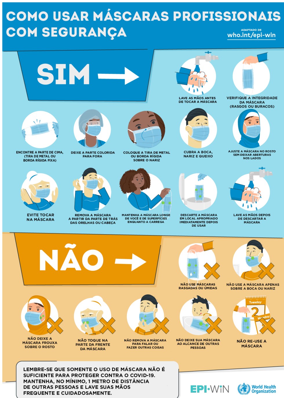
FIGURA 2 - Cartaz: Como usar máscaras profissionais com segurança

Original em inglês disponível para download em: https://www.who.int/emergencies/diseases/novel-coronavirus-2019/advice-for-public/when-and-how-to-use-masks