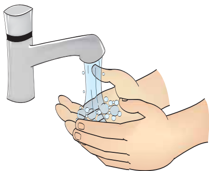
Higienização das mãos

Devem ser seguidas para TODOS OS PACIENTES , independente da suspeita ou não de infecções.