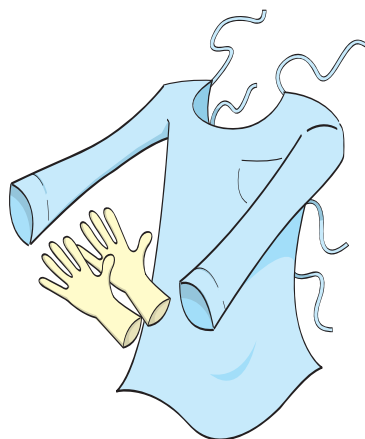
Luas e Avental