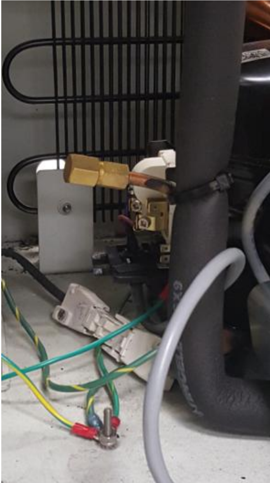
Figura 2. Ausência da Cobertura