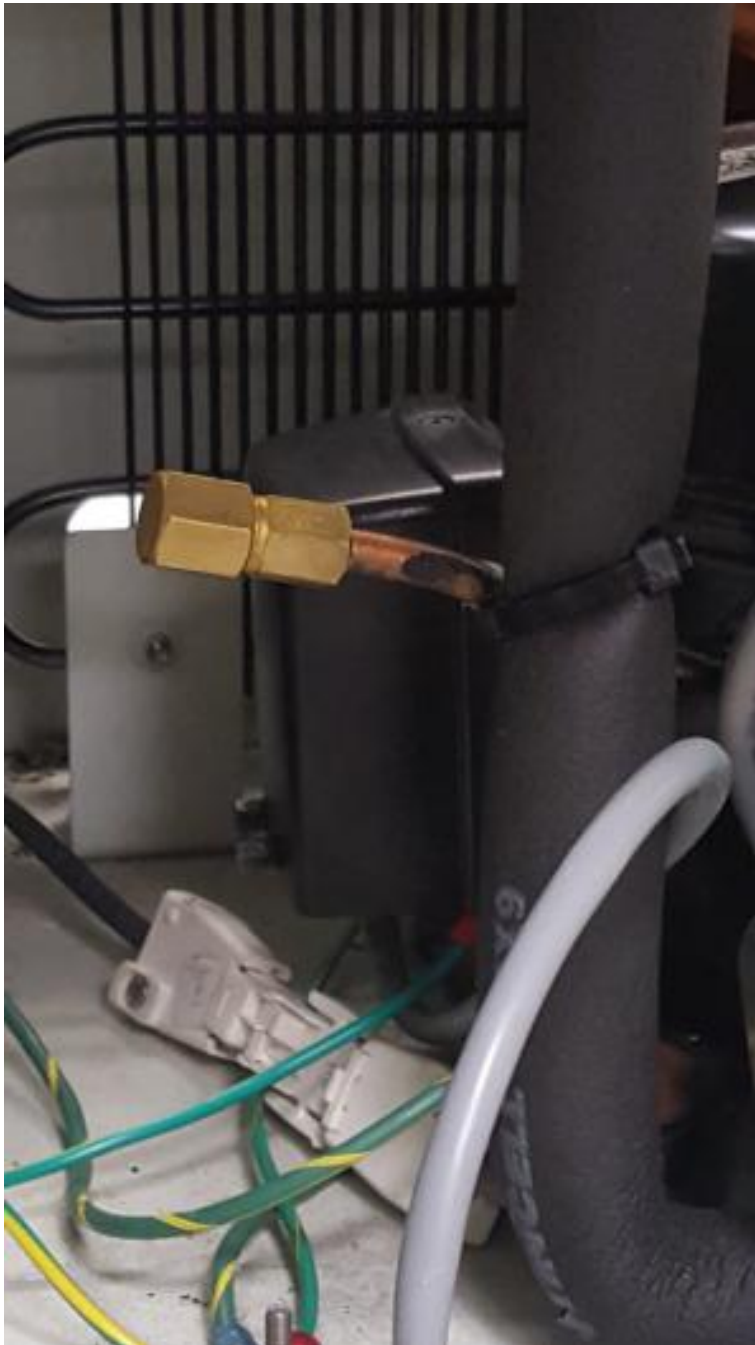
Figura 1. Cobertura no lugar correto