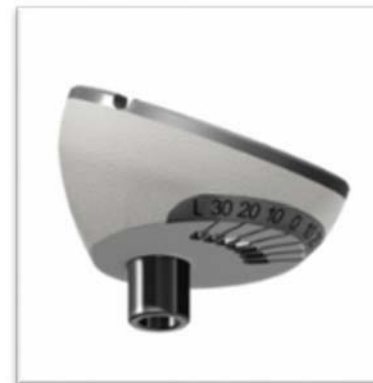
Figura 1: DELTA XTEND Epiphysis

Para os lotes sob alcance do recolhimento, uma investigação identificou que os lotes produzidos em uma determinada máquina foram fabricados de uma maneira na qual o diâmetro da vareta está fora de especificação. Outras investigações identificaram que o problema está relacionado à circularidade do cilindro. O problema circularidade pode fazer com que a epífise interfira na haste e os dois implantes (epífise e haste) talvez não possam ser montados.