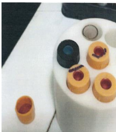
Figure 1. Tampa desacoplada na centrífuga

A figura 1 , abaixo, demonstra um exemplo do tubo com a tampa desacoplada. As reclamações informavam que essa situação ocorria durante a coleta e processamento da amostra (incluindo centrifugação, transporte e testes). O desacoplamento da tampa pode resultar em uma possível exposição ao sangue, o que poderia levar a uma exposição à patógenos transmissíveis, via sangue.