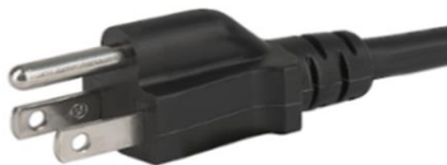
Figura 3: Plugue tipo B NÃO USE na Tailândia, Peru, Brasil

Para certos sistemas na Tailândia, Peru e Brasil, um plugue do cabo de alimentação tipo B classificado em 125V, conforme mostrado na Figura 3, foi remetido. A tensão da rede nesses países pode ser maior que 200V e, como resultado, esse plugue não deve ser usado. Se você estiver localizado em um desses três países com voltagem de rede maior que 200V e tem o plugue mostrado na Figura 3, desconecte seu sistema EXP II Achilles da fonte de alimentação de sua instalação e pare de usar o seu sistema. O seu cabo de alimentação será substituído pelo cabo de alimentação correto. Destrua o cabo de alimentação incorreto para garantir que ele não será usado.