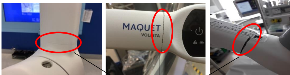
Fotos da rachadura do revestimento com tamanho diferente

Se detectar uma rachadura no revestimento na forquilha, PARE DE USAR o dispositivo e entre em contato com seu representante Getinge.