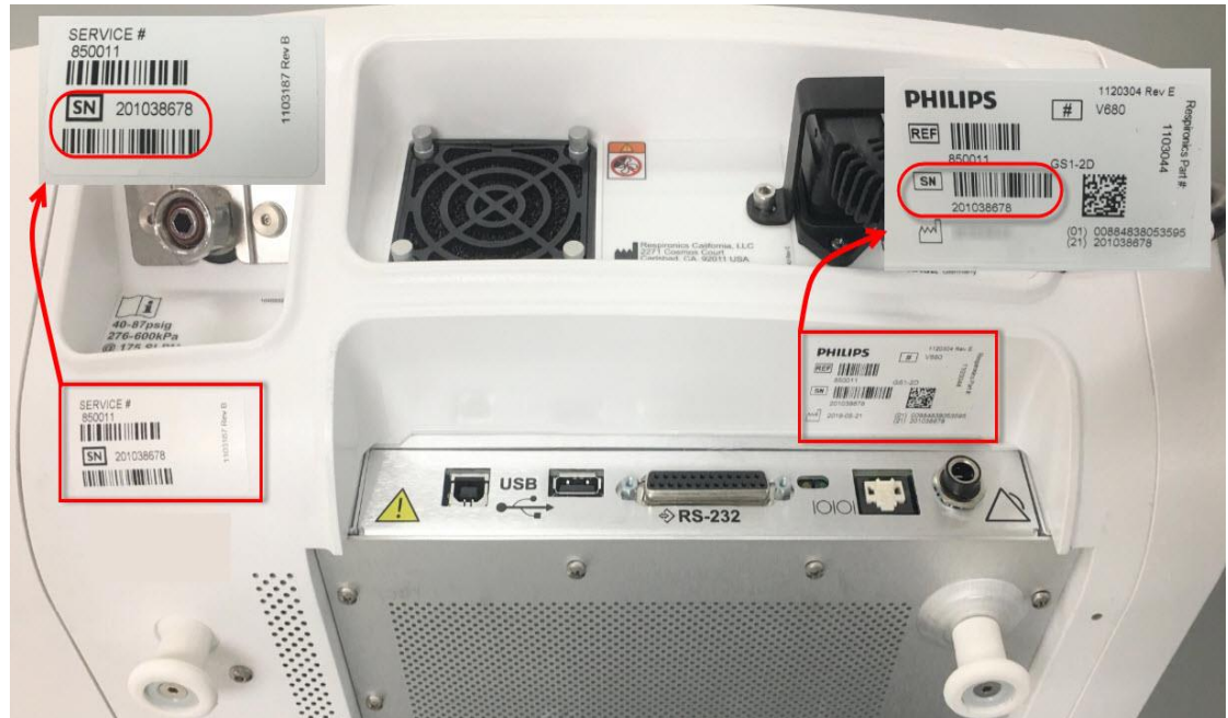
FIGURA 1: VISÃO TRASEIRA DO VENTILADOR V680

A rotulagem contendo informações de número de série pode ser vista localizada na traseira do ventilador. (Veja a Figura 1 )