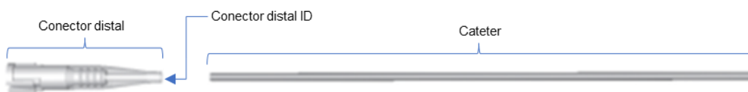
Figura 2: Seção distal do conector – inserção do cateter no conector distal