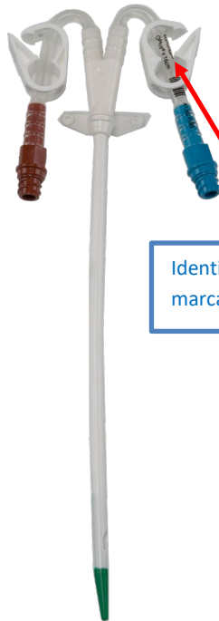
Extensão Curva 13.5 Fr