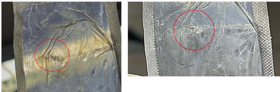
Figura 1 – Exemplos dos orifícios na embalagem

A BD confirmou que a embalagem das seringas BD Plastipak™ 10mL podem apresentar falha de selagem e/ou orifícios. A falha de selagem pode estar presente em qualquer ponto ao longo do perímetro da embalagem, já os orifícios, podem ser encontrados na área da flange da seringa, conforme ilustrados na figura 1 e 2, respectivamente.