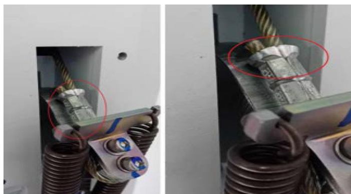
Figura 1. Terminal crimpado do cabo de aço

A Philips não recebeu nenhum relato desse problema ou de danos até abril de 2024.