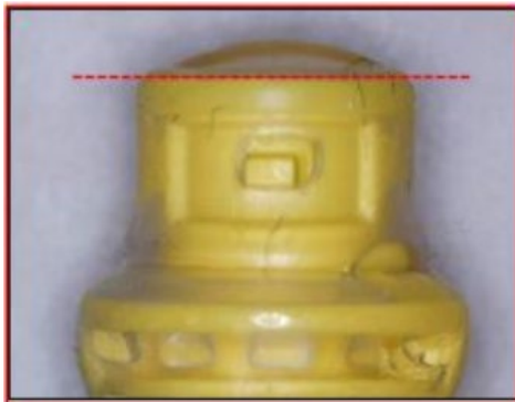
Figura 1: Abaulamento da Vedação de Silicone

A ICU Medical identificou problemas específicos de um lote com a vedação de silicone do dispositivo Tego. Os defeitos identificados na vedação de silicone incluem: abaulamento da vedação de silicone (ver Figura 1), que ocorre devido a uma vedação de silicone solta, que pode formar uma protuberância na superfície superior ou se separar do corpo do Tego, podendo resultar em vazamentos de fluido; e rasgo da vedação de silicone (ver Figura 2), resultando no colapso da vedação de silicone e a obstrução do fluxo de fluido ou vazamentos de fluido.