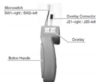
Figura 1 Microinterruptor e conectores de sobreposição no puxador

Se um usuário, ao limpar ou desinfetar o sistema MobileDiagnost wDR, utilizar líquidos em excesso ou se o líquido for borrifado diretamente no sistema, é possível que este penetre nas bordas dos botões do puxador e cause corrosão do metal ou um curto-circuito elétrico no conector de sobreposição (consulte a Figura 1). O sistema tem quatro (4) botões nos puxadores que controlam o movimento de cada roda motriz (para a frente/para trás). Se o sistema sofrer um curto-circuito elétrico devido a esse problema, o sistema poderá mover-se sozinho em movimento lento (20 cm/s). A essa velocidade, pessoas próximas podem facilmente se afastarem do sistema sem sofrer ferimentos. O usuário pode acessar facilmente o botão Parada de Emergência e interromper o movimento do sistema. O problema não ocorre quando o líquido seca.