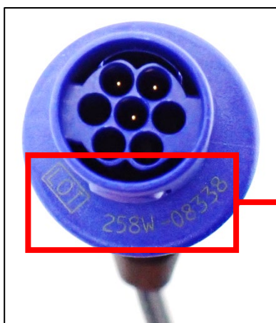
Figura 1: Ponta do plugue do gerador

Para seguir as instruções de uso, determine a vida útil do dispositivo. Para auxiliar nessa determinação, o mês e o ano de fabricação podem ser identificados a partir do número do lote impresso na face frontal da ponta do plugue do gerador, conforme ilustrado abaixo.